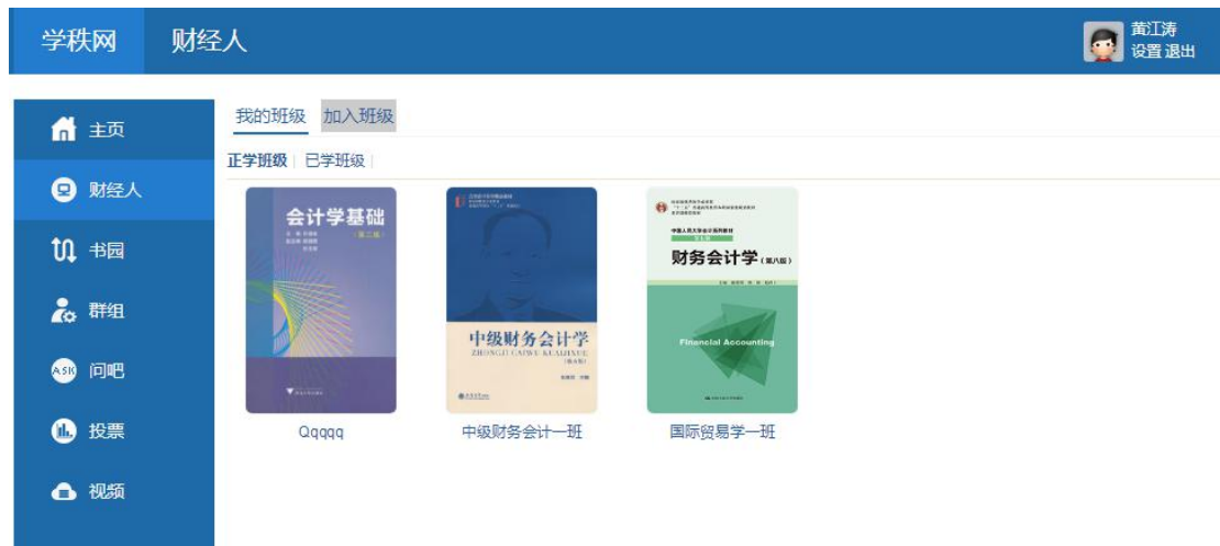
图 3-2 我的班级

3、如图 3-3，页面显示本班的学生信息和班级的授课教师以及开课时间段。在这里单击【在线测试】。