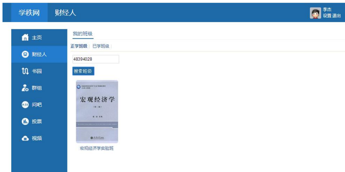
图 2-2 搜索班级