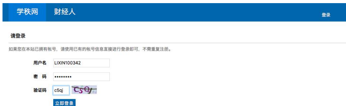
图 3-1 学秩网

1、如图 3-1，登录学秩网： http://www.4i-edu.com/ ，输入用户名，密码，验证码点击登录。