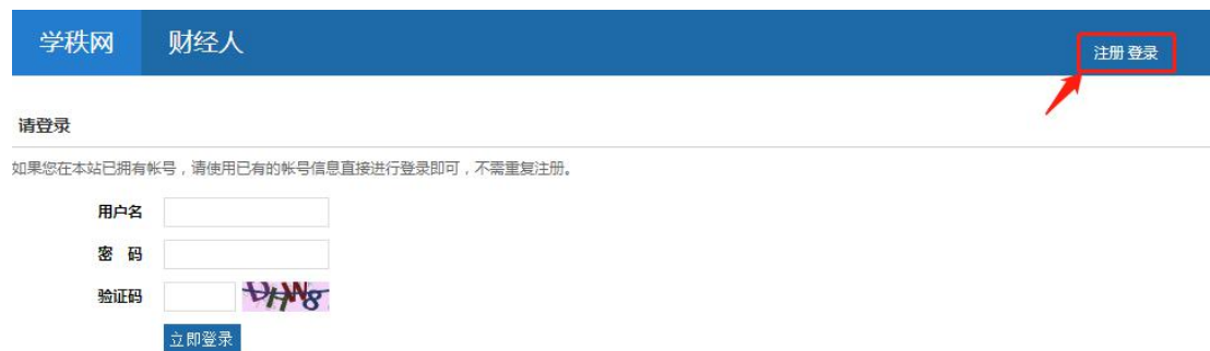
图 1-1 首页

1、前期未在学秩网或者银题库生成过学生账号的用户，可以在学秩网自主注册学生账号，该账号可以同时用于登录学秩网（PC 端）和银题库（APP 端）。如图 1-1，打开学秩网 http://www.4i-edu.com/ ，点击右上角的【注册】