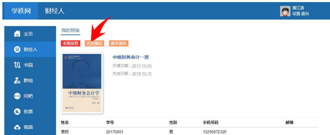
图 3-3 班级信息

3、如图 3-3，页面显示本班的学生信息和班级的授课教师以及开课时间段。在这里单击【在线测试】。