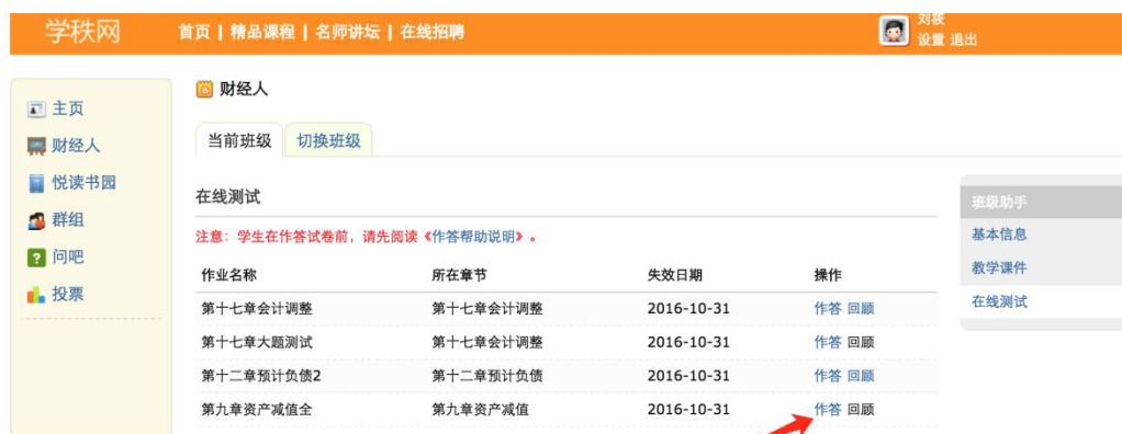
图 3-4 答题

4、依据图 3-1， 3-2， 3-3 步骤进入个人主页，点击箭头所示“作答”按钮。